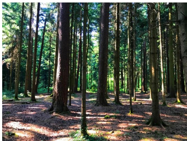
„Kursraum 3“ Wald

Kursort: wechselnder Treffpunkt, je nach Wetter! Sonnig, warm: „Kursraum 3“ Wald (Ecke Wannenstrasse/Wildsbergstrasse Bus 817) Kühl, bewölkt: Schiffsteg Uster (Bus 817 von Bahnhof Uster ab 13.45 Uhr) Nass, Regen: Stunde fällt aus! Siehe Mindbody Buchungssystem Tipp: Nutze die App Mindbody connect, Infos dazu auf unserer Webseite unter Service, Mindbody